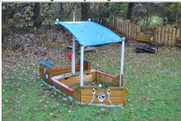
Redskab: Legebåd Producent: Er redskabet mærket: Nej Emne 41: Er der registreret fejl / mangler: Ja

Er redskabet mærket: Nej Emne 40: Er der registreret fejl / mangler: Ja