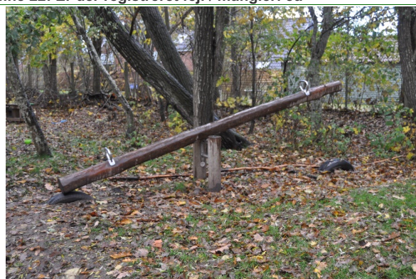
Redskab: Vippe Årgang: Producent: Uniqa Er redskabet mærket: Ja Emne 24: Er der registreret fejl / mangler: Ja