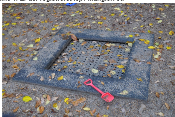
Redskab: Trampoliner Producent: Er redskabet mærket: Nej Emne 6: Er der registreret fejl / mangler: Ja