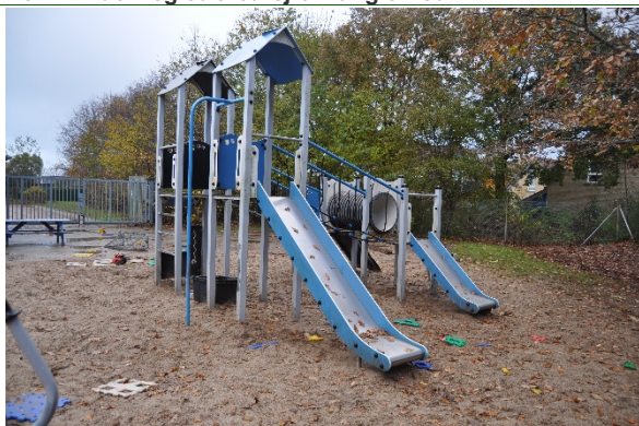
Redskab: Klatretårn m. rutsjebane Producent: BabyCam Er redskabet mærket: Ja Emne 9: Er der registreret fejl / mangler: Nej