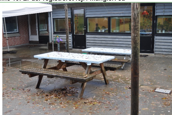
Redskab: Bordbænke Ikke omfattet af DS/EN 1176 Emne 12: