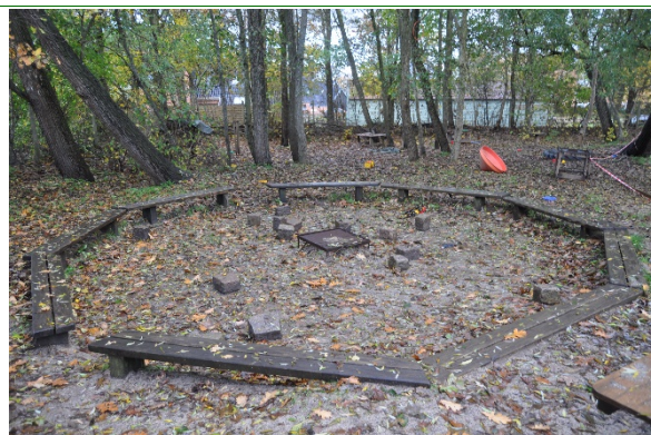
Redskab: Bålplads Ikke omfattet af DS/EN 1176 Emne 20: