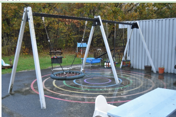
Redskab: Gyng Producent: BabyCam Er redskabet mærket: Ja Emne 39: Er der registreret fejl / mangler: Ja