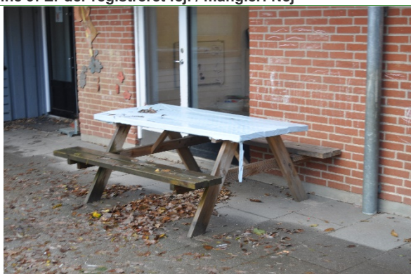
Redskab: Bordbænke Ikke omfattet af DS/EN 1176 Emne 11: