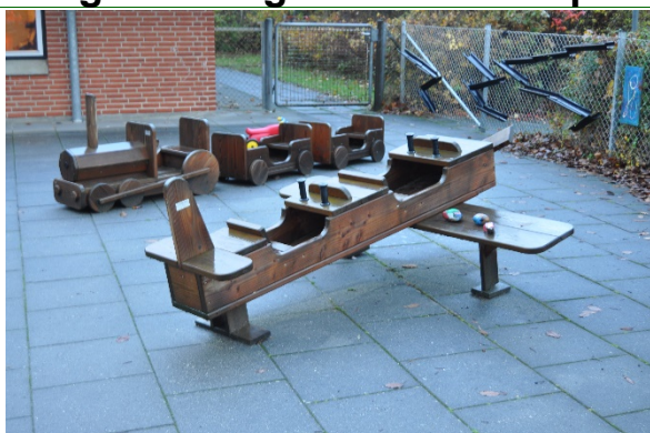
Redskab: Legeredskab Producent: Legebussen Er redskabet mærket: Ja Emne 1: Er der registreret fejl / mangler: Nej