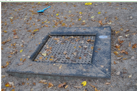
Redskab: Trampoliner Producent: Er redskabet mærket: Ja Emne 5: Er der registreret fejl / mangler: Ja