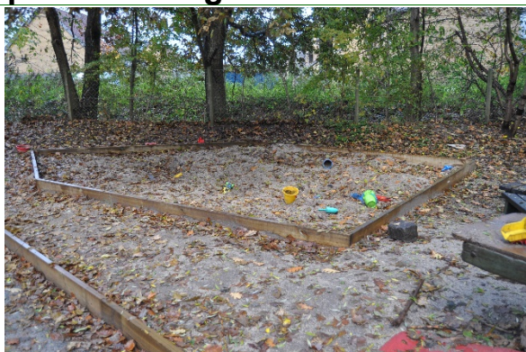
Redskab: Sandkasse Årgang: Producent: Er redskabet mærket: Nej Emne 19: Er der registreret fejl / mangler: Nej