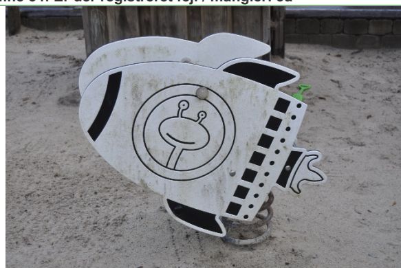
Redskab: Vippedyr Producent: BabyCam Er redskabet mærket: Ja Emne 36: Er der registreret fejl / mangler: Nej