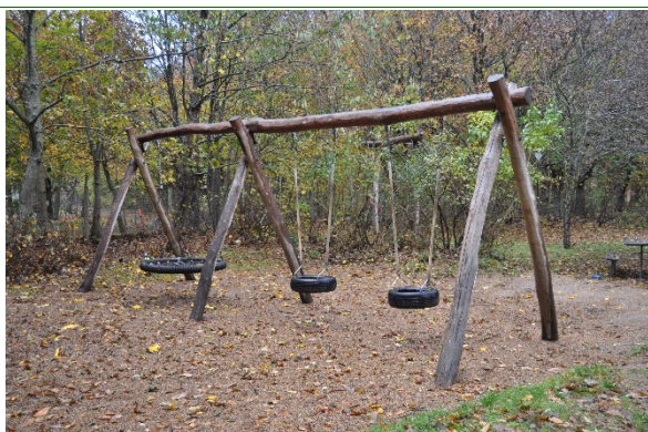
Redskab: Gynger Årgang: Producent: Uniqa Er redskabet mærket: Ja Emne 25: Er der registreret fejl / mangler: Ja