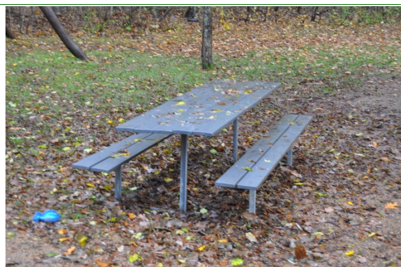
Redskab: Bordbænke Ikke omfattet af DS/EN 1176 Emne 26: