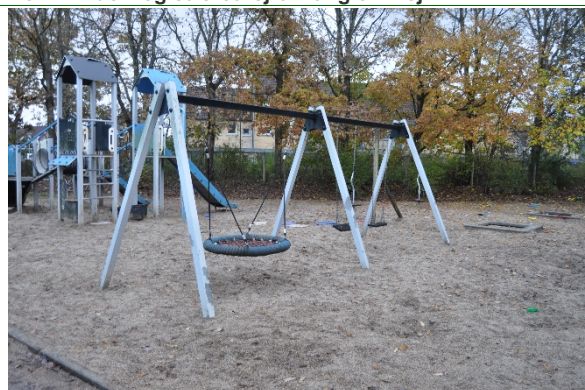
Redskab: Gynger Producent: BabyCam Er redskabet mærket: Ja Emne 4: Er der registreret fejl / mangler: Ja