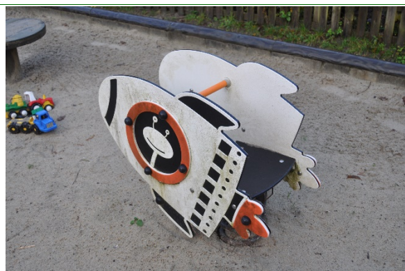
Redskab: Vippe dyr Producent: BabyCam Er redskabet mærket: Ja Emne 32: Er der registreret fejl / mangler: Nej