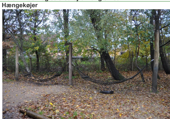
Redskab: Hængekøjer Producent: Uniqa Er redskabet mærket: Ja Emne 10: Er der registreret fejl / mangler: Ja