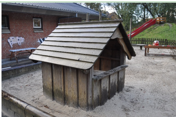
Redskab: Legehus Producent: Uniqa Er redskabet mærket: Ja Emne 31: Er der registreret fejl / mangler: Ja