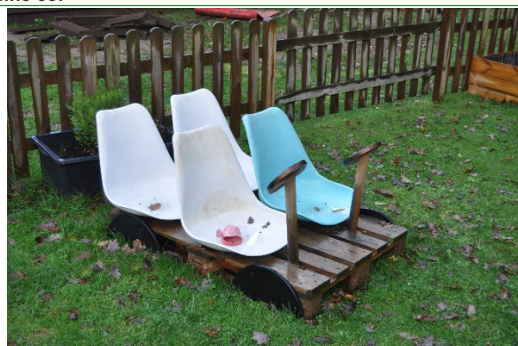
Redskab: Legebil Producent: