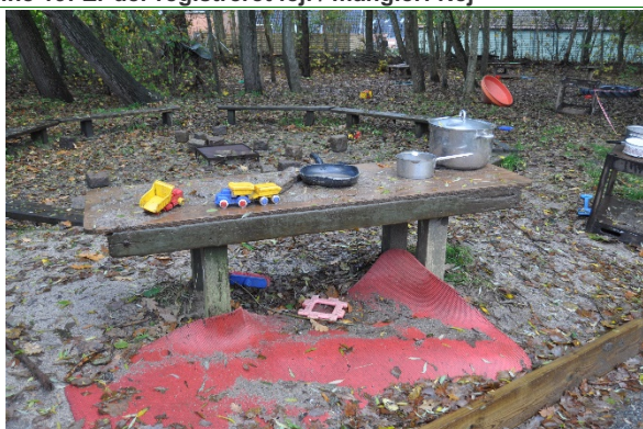
Redskab: Legebord Årgang: Producent: Er redskabet mærket: Ja Emne 21: Er der registreret fejl / mangler: Ja