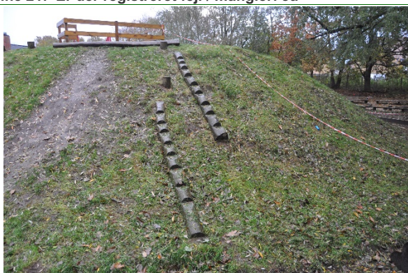
Redskab: Skråningstrappe Årgang: Producent: Uniqa Er redskabet mærket: Ja Emne 23: Er der registreret fejl / mangler: Ja