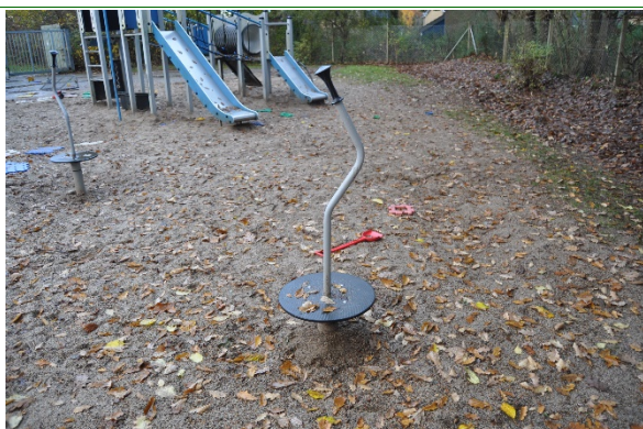
Redskab: Spinner Producent: BabyCam Er redskabet mærket: Ja Emne 7: Er der registreret fejl / mangler: Ja