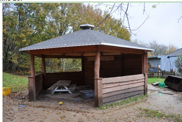
Redskab: Madpakkehus Ikke omfattet af DS/EN 1176 Emne 28: