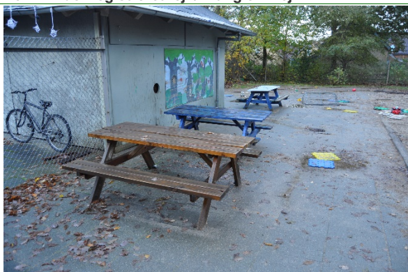
Redskab: Bordbænke Ikke omfattet af DS/EN 1176 Emne 3: