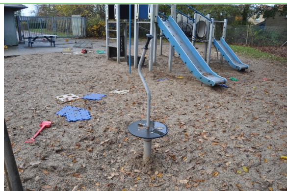
Redskab: Spinner Producent: BabyCam Er redskabet mærket: Ja Emne 8: Er der registreret fejl / mangler: Ja