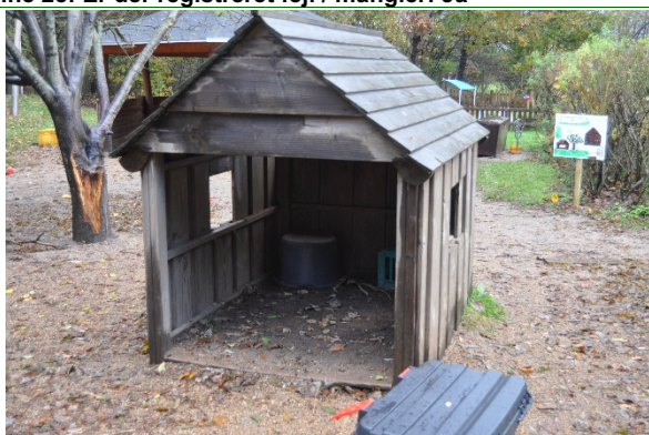
Redskab: Legehus Årgang: Producent: Uniqa Er redskabet mærket: Ja Emne 27: Er der registreret fejl / mangler: Ja