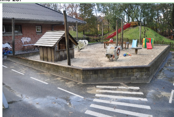
Redskab: Sandkasse Årgang: Producent: Er redskabet mærket: Nej Emne 30: Er der registreret fejl / mangler: Nej