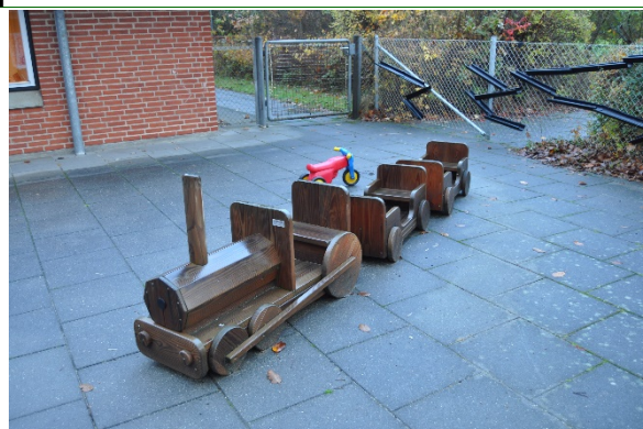
Redskab: Legeredskab Producent: Legebussen Er redskabet mærket: Ja Emne 2: Er der registreret fejl / mangler: Nej