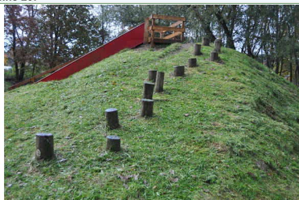
Redskab: Balancestolper Årgang: Producent: Er redskabet mærket: Ja Emne 22: Er der registreret fejl / mangler: Ja